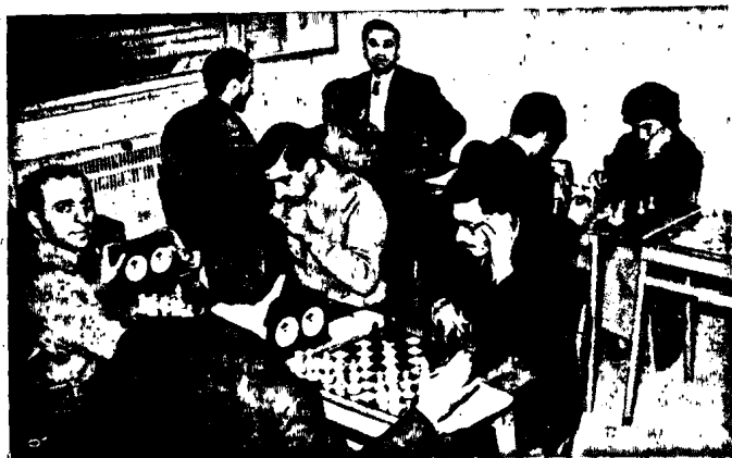
En la sala de juegos los aficionados al ajedrez juegan varias partidas.