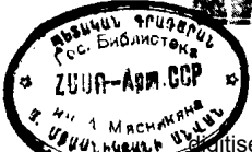
ՕՐ. ԱԼԻՍԻԱ ԹԵՐՂԵԱՆ