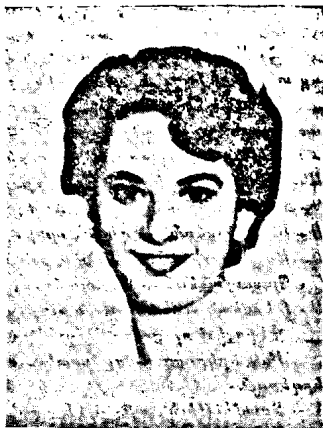
ՕՐ. Ս. ՊԼԱՆՔՕ ԼԱՍԴԵՉԷ

Շատ քիչ անգամ գեղարուեստական երեկոյթ մը կրցած է տալ մեզ այն հոգեկան գոհունակութիւնը, որ ունեցանք այս անգամ։