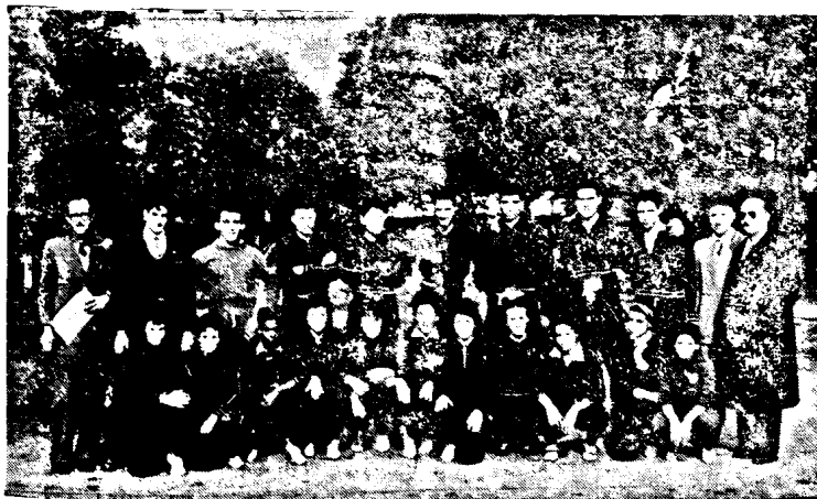
La delegación atlética del Club San Lorenzo de Almagro, con algunos participantes de nuestra entidad, antes de iniciar el torneo exhibición.

Septiembre 23, a las 15,30 hs.: Lanzamiento de bala, para infantiles, damas, cadetes y caballeros. A las 18 hs.: Carrera 3.000 mts. para cadetes y caballeros.