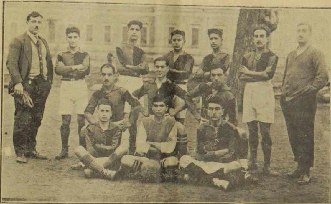
Հ. Մ. Ը. Մ. ի Գումգարուի խումբը 1921ի ՇԱՄԱՐՈՒԹԵԱՆ մրցումն վերջ

Այս առաջին մրցման մէջ երկու կողմն ալ ու-