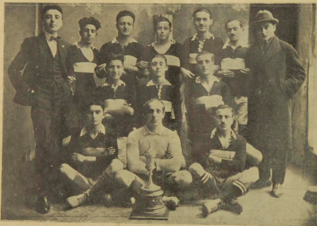
Հ. Մ. Բ. ՆՄ. Ի Բերա-Շիշիի խումբը եւ 1921 ի իրենց շահած շամբիօնուրեան բաժակը:

Ա. 6 նոյեմ կէս օրէ վերջ, մրցումը չ'եղեալ նրկատուեցաւ՝ խաղը որոշեալ ժամուն սկսուած չըլլալու, եւ դուրսէն խաղացոյ առնուած ըլլալուն, պատճառներով: Դատաւոր Պ. Աստիկ Պաղտասարեան: