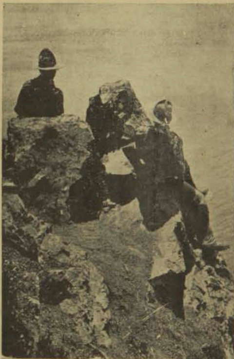
Հայ սկաուտները Խալէի կղզին 1921

Իուք բնդ հակառակին առիք ձեր վրայ անոյզիտական բառը, որ Հայերուս ականջին մեռեալ ձայն մ'է, զուրկ որ և է նշանակութեանէ. որ առանձին հրահանգութեան մը կը կարօտի հասկցուելու համար, և այն՝ քիչերուն կողմէ: Այ, ես կը բաղձայի կոչել զձեզ այնպիսի անուամբ մը, որ նոյնքան պերճախօս ըլլայ մեր շրթներուն վրայ՝ որքան սկաուտն Անգղիացւոյն: Չեր հիմնադիրն ուղեց այդպէս կանդանի և իմաստալից կոչում մը