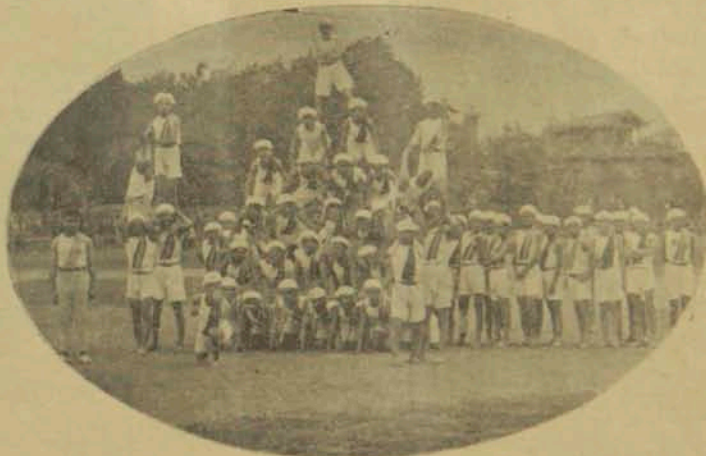
1921 ի ողիմպիականներն.

Այս մրցումները շատ մը մրցորդներ հը- մայեցին և համա- լսարանի սովորոյթ- ներուն վրայ մեծ ազդեցութիւն մը ուէ եցան: Մինչ մէկ կողմէն երիտասար- դութիւնը կըրթա- կան նեւ օրէնքնե- րուն գէժ կ'մրոս- տանար, միւս կող- մէն կըրթական վաս- տակաւորները ի-