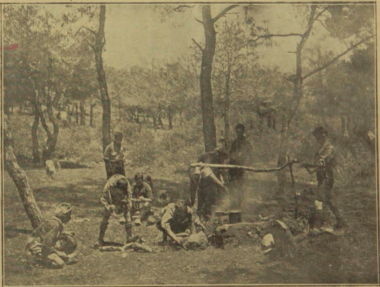
Հայ Սկաուտներ բանակումի մէջ 1920 ին

Սկաուտական միջավայրը շատ բարձր բարոյականով մը շրջապատուած է՝ ան ուղի- ղակի մարդկային խիղճը կը մարբագործէ և մտածելակերպը կը բարձրացնէ: