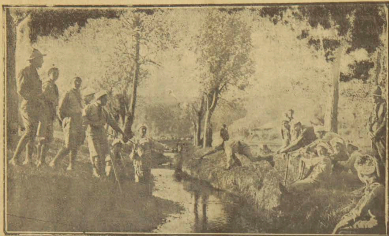
Գասրգիւղի Երզանի սկաուսներու խումբը, Պալքալիմանի Երզակայներ պոյսի միջոցին

ղը, յաճախ թեւ թեւի, զուարթ. երկուքը զիրար կ'ըմբռնեն, իրարու հոգւոյն մէջ կը մըտնեն, զիրար կը սիրեն, ու կը բաժնուին իրարմէ՝ իրրեւ՝ սրտակից անկեղծ բարեկամներ, կարելի եղածին չափ շուտ վերստին միանալու սրտագին փափաքով: