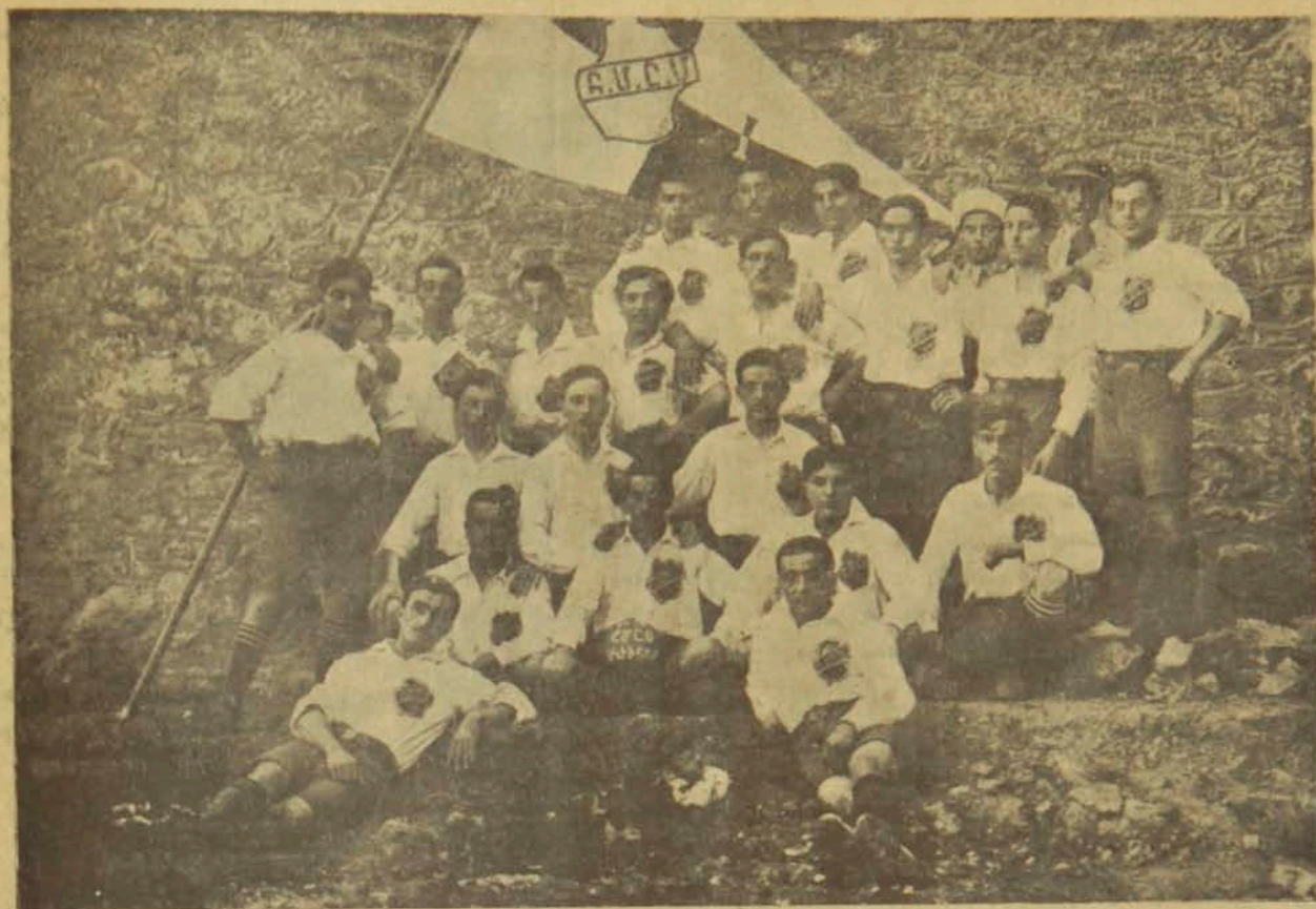
Ղ. Մ. Բ. Մ.ի Սկիւսարի Մասնանիւղի Ֆութպօլի խումբը (Մեր նախորդ թիւով յիշած)